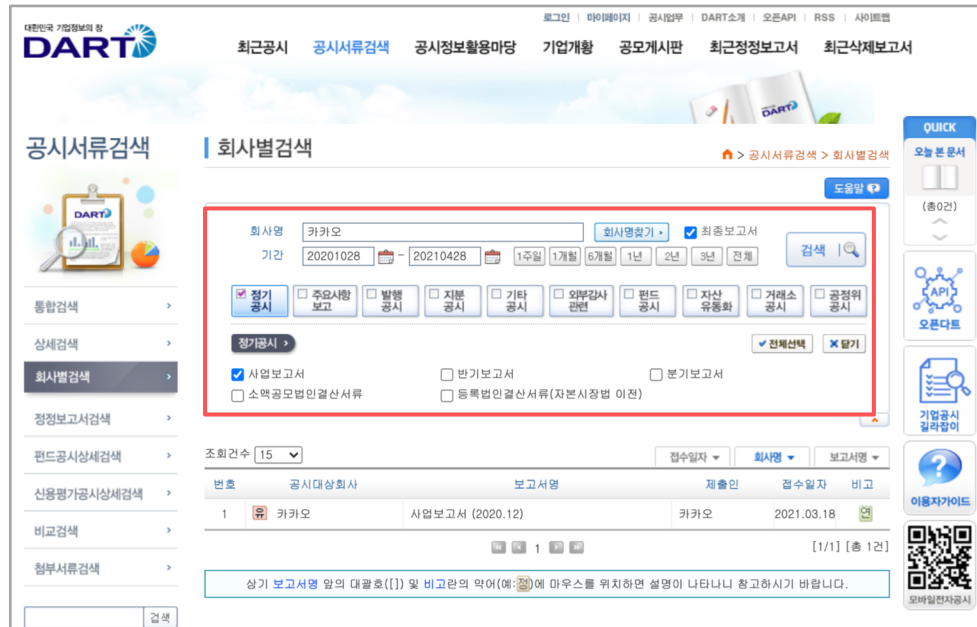
금융감독원 전기공시시스템 dart.fss.or.kr 화면