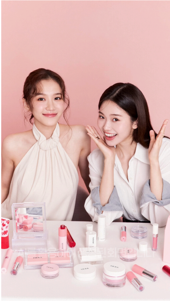
꿈수 표기 금지